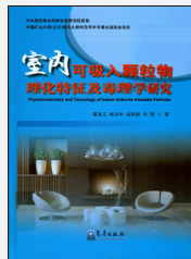
《室内可吸入颗粒物理化特征及毒理学研究》

编著者：中国气象局应急管理办公室 出版者：气象出版社 出版年：2012 索书号：P429/219