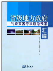
《省级地方政府气象灾害专项应急预案汇编》

编著者：陈联寿等 出版者：气象出版社 出版年：2012 索书号：P429/170/21