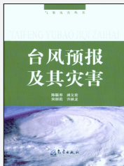
《气象灾害丛书——台风预报及其灾害》

编著者：陈联寿等 出版者：气象出版社 出版年：2012 索书号：P429/170/21