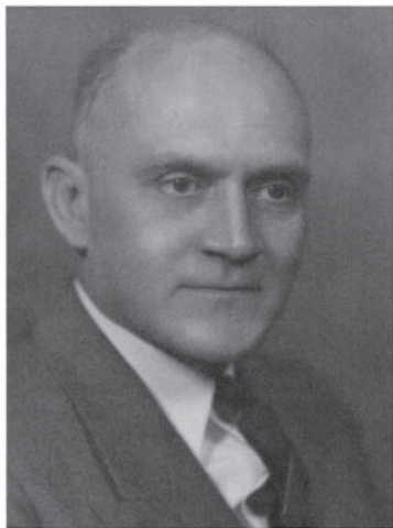
图1 弗·乌·赖克尔德弗博士（Dr. Francis Wilton Reichelderfer, 1895—1983年）

弗·乌·赖克尔德弗（图1）1895年8月6日出生在美国印地安那州东北部小城Harlan的一个牧师家庭。1913年他中学毕业时，全家迁到芝加哥北部的Evanston，这样父亲得以进入著名的Protestant学院当管理员，赖克尔德弗进入西北大学接受高等教育。赖克尔德弗在回忆起大学时代的生活时，不无感慨地说，