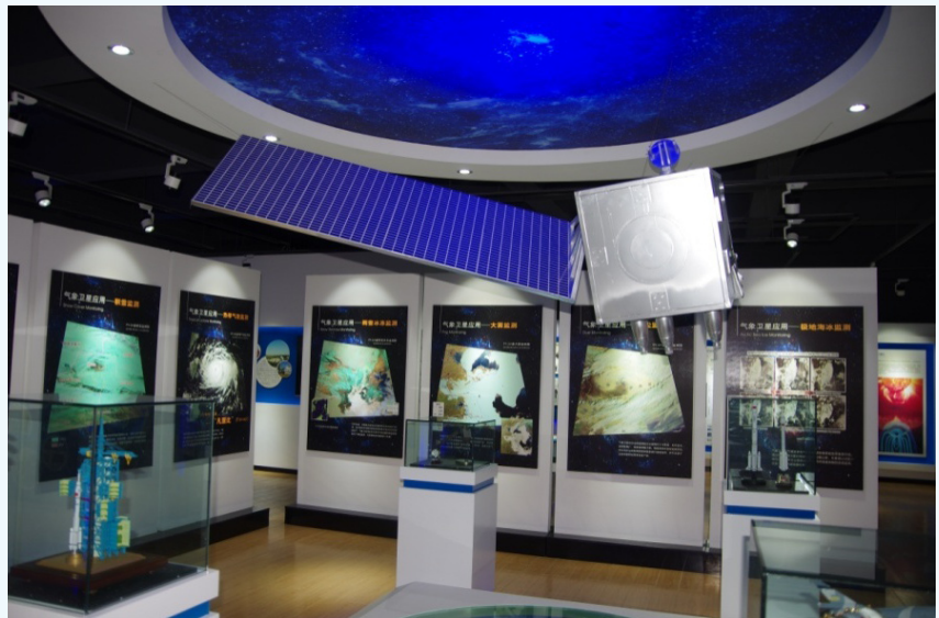
图3 佳木斯站卫星科普宣传展厅

受到接收解调系统设备限制, 目前佳木斯站仅能同时处理2颗极轨卫星数据接收和1颗静止卫星的测距, 待天线全部建成后, 将具备同时处理多颗极轨卫星接收和多颗静止卫星测距能力。