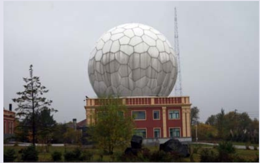
图2 佳木斯站极轨卫星系统12m口径卡塞格伦式天线

受到接收解调系统设备限制, 目前佳木斯站仅能同时处理2颗极轨卫星数据接收和1颗静止卫星的测距, 待天线全部建成后, 将具备同时处理多颗极轨卫星接收和多颗静止卫星测距能力。