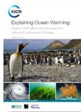
《解释海洋变暖：原因、规模、影响和结果》 2016年9月25日

这份由国际自然保护联盟推出的报告，作者包括了来自12个国家的80位专家。报告瞄准海洋升温带来的挑战，指出20世纪70年代以来，在人类活动导致的气候变暖中，有97%的热量被海洋吸收。这表明在某种意义上，海洋和大气一样甚至更有过之，是受到气候变暖损害的地球环境要素。