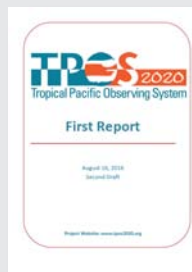
《TPOS 2020》 2016年8月

热带太平洋观测系统(TPOS)2020项目推出的第一份报告(第2草稿版)继续听取科学界的意见。按照计划，年末第一份报告将定稿发布，2018年出版中期报告，该项目的最终设计报告在2020年出炉。