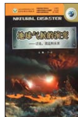
《地球气候的演变: 过去、现在和未来》