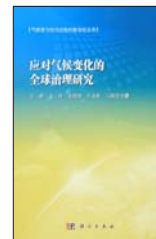
《应对气候变化的全球治理研究》

编著者: Paolo Paron, Giuliano Di Baldassarre 出版者: Elsevier 出版年: 2014年