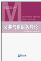
《公共气象服务导论》