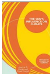
The Sun's Influence on Climate 《太阳对气候的影响》

编著者: R. Giles Harrison 出版者: Wiley-Blackwell 出版年: 2014