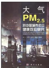
《大气PM 2.5 对中国城市公众健康效应研究》