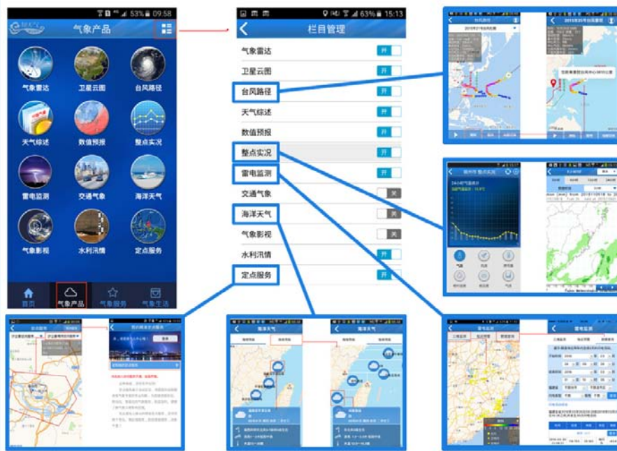
图4 专业气象服务产品

“气象雷达 [15] ”动画播放、自由伸缩方式展示福州、厦门等单站，以及福建、全国、华南、华东、东南、台湾地区雷达拼图，单站雷达产品6min更新1次，且实现与首页城市站点自动合理匹配功能，以及快速调用手机联系人拨号功能。“台风路径”基于GIS地图动态绘制各个时间点台风信息、播放台风实