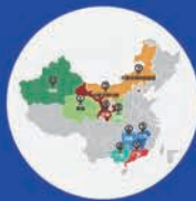
“应对气候变化·记录中国”活动的足迹

公服中心打造的品牌活动“应对气候变化·记录中国”自2010年起已经举办了10期,走进青海、内蒙古、江西、广西、广东、湖南、甘肃、陕西、新疆等地,实地考察当地的气候变化情况,为公众呈现出具象的、立体的、科学的气候变化事实。