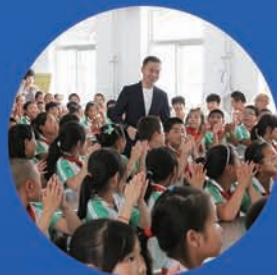
气象主持人走进北京密云大城子镇中心小学

公服中心拥有中国气象频道、中国天气网、中国兴农网、中国天气通和12379网站等气象媒体,并长期与中央电视台、中央人民广播电台、凤凰卫视等知名大众传媒密切合作,科普渠道数量多且影响力大。其中,中国气象频道现有23个气象科普栏目,中国天气网开辟了四类12个科普专题。