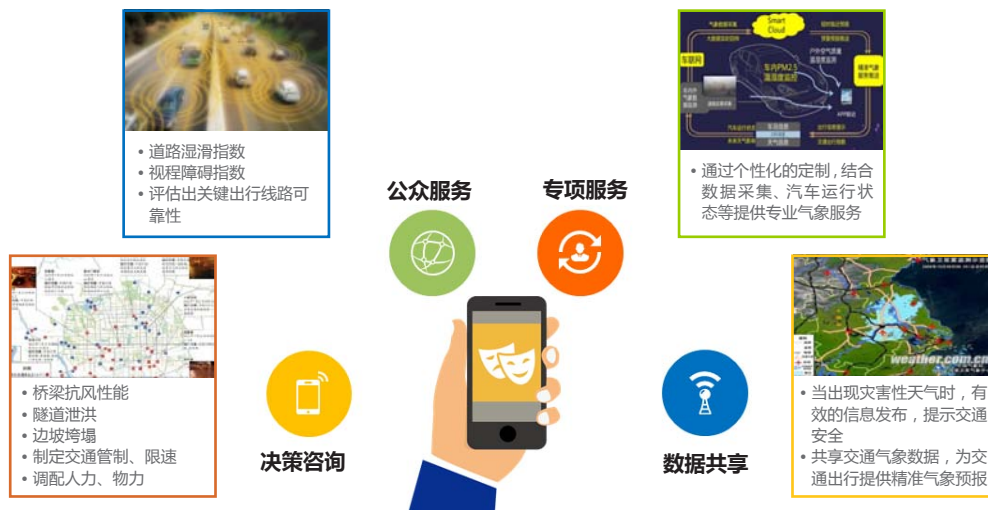
图3 大数据应用于交通气象服务示意图

3) 旅游突发气象事件保障: 针对灾害性天气, 各级气象部门会发布相应的预警信号作为提醒。通过大数据时代的信息采集, 可以实现游客集中景点、区域和灾害性天气预警区域叠加分析, 制定预警信息发布优先级别、发布范围等, 实现精准服务; 景区管理人员和旅游行政管理人员能够准确及时获取结合了灾害天气和游客密度的事件危险程度信息, 做好应急决策。