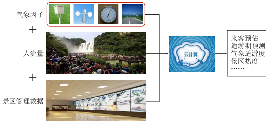
图2 旅游气象服务产品开发示意图

2) 游客服务方面：通过包括短信、声讯、手机app、网站、微信等多渠道向游客提供景区热度、气象适游度、推荐景区、路线等旅游气象产品，甚至可以结合出行天气订制个性化的旅游路线，为游客出行提供参考。