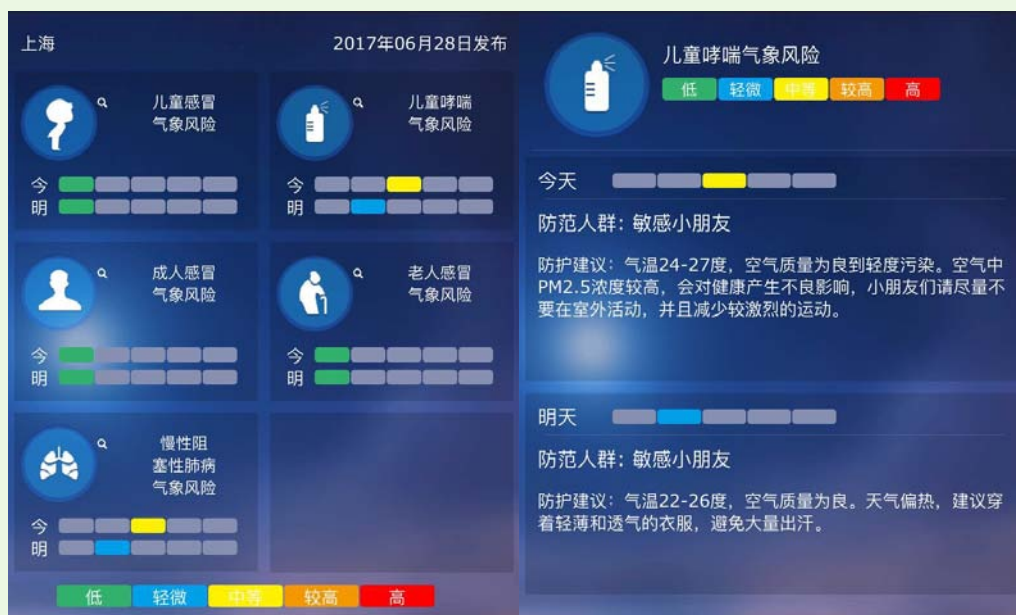
图1 “健康气象”微信公众号发布呼吸系统疾病气象风险预报产品

行了广泛的推广应用（图1），面向公众和易感人群在多家学校、医院、社区服务中心常态化开展。其中儿童哮喘气象风险预报产品还通过儿童专科医院的微信和APP提醒患儿家长及时防范极端天气和大气污染的健康危害。