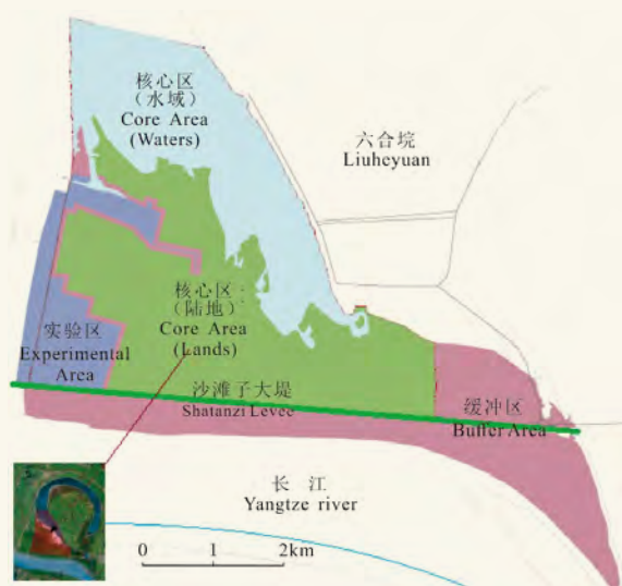
图1 石首麋鹿国家级自然保护区功能划分与分布图

石首麋鹿自然保护区1991年经湖北省人民政府批准成立,1998年国务院批准为国家级自然保护区。保护区主要保护对象为麋鹿及其生境,总体上由实验区、核心区和缓冲区构成,总面积15.67 hm 2 (图1)。目前,保护区仅对实验区和核心区享有自主管理权。