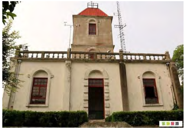
图4 经过修葺后的军山气象台遗址

可以说，张謇创办的军山气象台，不论是各种设施设置还是各项业务水平，均在当时处于遥遥领先的地位，当之无愧为“中国私家气象台之鼻祖”（图4）。