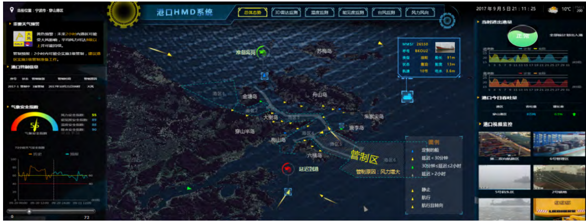
图1 港口3D可视化宏观态势呈现 Fig. 1 Port 3D visualization macro situation

图”展示(图1),以所见即所得的方式,将多源信息叠加在3D-GIS上呈现。以全景视图形式,通过二维仪表盘和三维场景数据联动等,综合展示港区运行态势;以气象数据驱动场景变化,呈现“运行中”的港区;通过多种显示模式,将主干信息从海量数据中突出显示。支持全终端运用,支持多屏无缝切换。