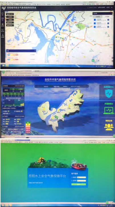
图6 内涝、空气质量、水上平台系统主页面