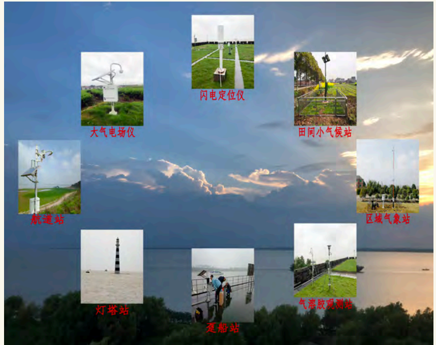
图5 洞庭湖腹地通量梯度观测塔