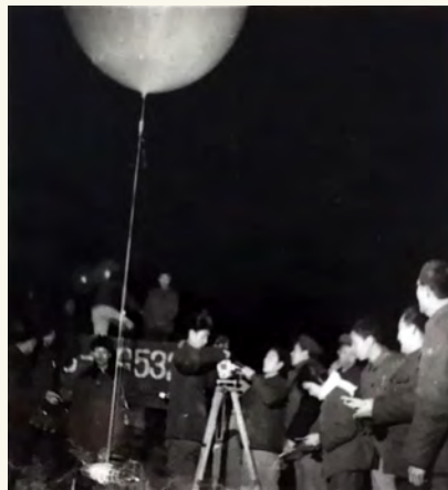
图2 1971年气象员在岳阳化工总厂施工地开展逆温层探空观测

动气象站、农田小气候站、气溶胶站、闪电定位仪、大气电厂仪、水上气象站、城市内涝站、通量梯度观测塔(图5)逐步完成布局,在结合气象和环境监测数据研究的基础上,建立面向服务对象的专业数据库,对气象和非气象数据进行信息化处理,通过模式分析和格点预报处理等方法,建立针对不同预报对象的预报预警模型,运用GIS等方法,采用客户端和服务端分离模式,为洞庭湖区域城市内涝、空气质量、水陆交通安全、湿地生物多样性评估、中国天然氧吧和夏季避