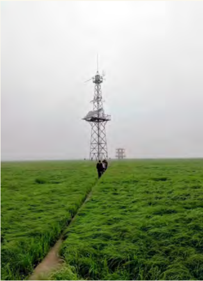
图4 综合立体气象监测站网