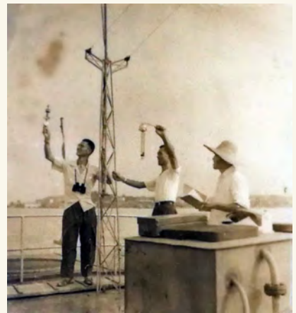
图3 1981年气象人员在夏船上手持观测仪器进行水面气象观测