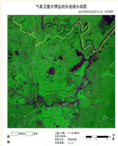
图8 2019年9月23日FY-3D/MERSI洞庭湖水体(裸水)监测图

洞庭湖生态保护和修复提供科学依据。通过卫星遥感湖泊水体监测洞庭湖水体面积可见,2019年洞庭湖区域的严重干旱导致洞庭湖面积急剧下降,9月23日05时洞庭湖水体(裸水)面积为829.89 km 2 (图8),较7月3日14时洞庭湖水体(裸水)面积1847 km 2 减少了1017.11 km 2 ,减少比例为55%,客观地说明了长时间干旱少雨给洞庭湖生态造成的影响。