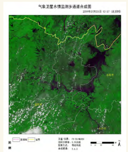
图9 2019年7月3日FY-3D/MERSI洞庭湖水体(裸水)监测图