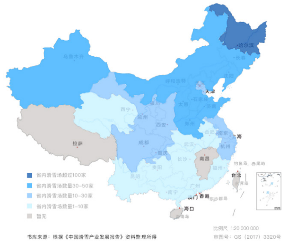
图2 2019年全国雪场区域分布地图

我国冰雪产业有着明显的资源优势,近两年不断新建滑雪场。北方地区的冰雪资源先天优势明显,拥有我国72.76%的雪场(图2)。