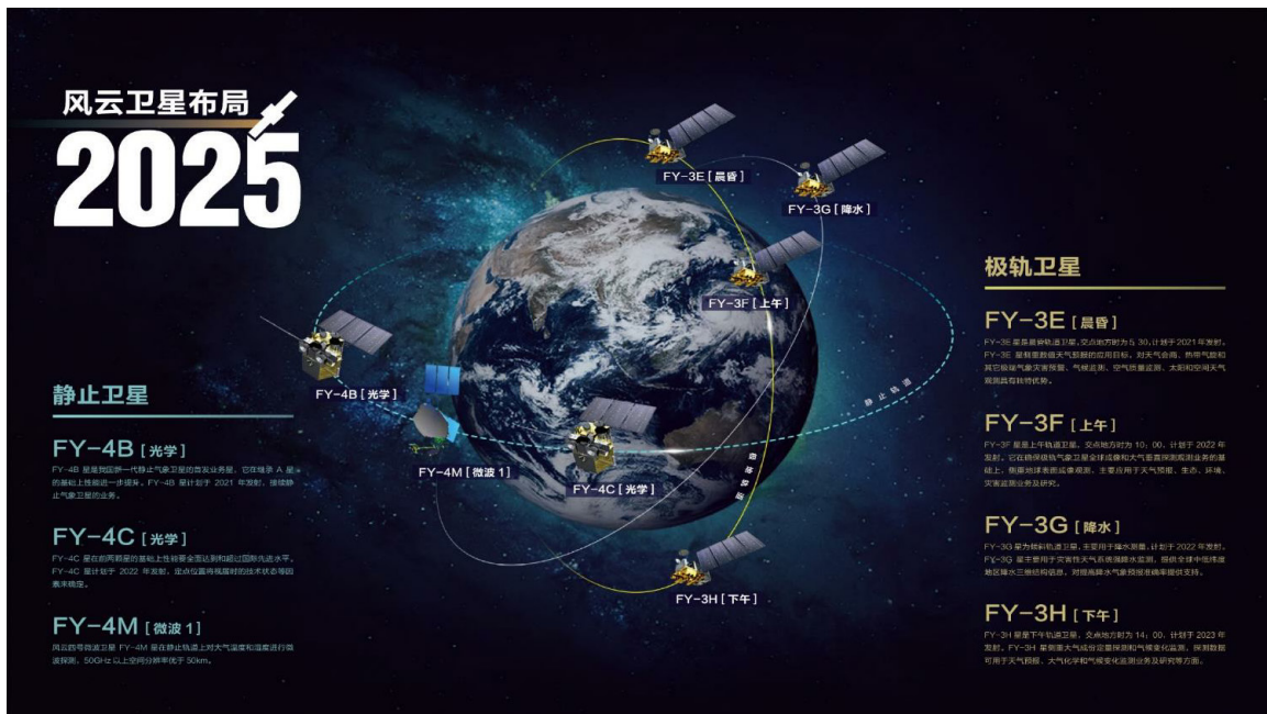
图3 风云卫星2025年规划布局 Fig. 3 Layout of FengYun Satellites 2025 Planning

时为17:40。它与风云三号C星和D星实现了晨昏、上午、下午轨道卫星组网观测，4小时获取全球气象观测数据，为全球数值天气预报提供有力支撑 [22] 。2016年和2021年发射的静止轨道气象卫星风云四号A星和B星，分别定点于105°E和133°E，首次在静止轨道卫星上装载了干涉式大气垂直探测仪。风云四号A星和计划于2024年发射的风云四号C星上均配有闪电成像仪。风云四号微波星也已立项。这些任务的实施，既是对我国气象卫星规划的有利执行，也最大限度满足了GOS 2025年远景发展规划，为全球观测系统做出了重要贡献(图3)。