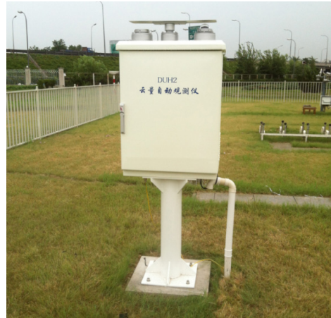
图5 DUH2云量自动观测仪 Fig. 5 DUH2 Automatic cloud observation instrument

天顶角修正、球面投影、水汽修正等方式可获得全天空的红外辐射分布，再进行分割处理，可获取云量信息。华云升达（北京）气象科技有限责任公司的DUH2型云量自动观测仪（图5）包含了可见光波段及8-14um的红外波段 [24] ，可实现昼夜的云量自动测量。