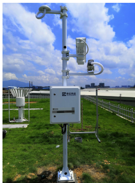
图7 天气现象视频智能观测仪(安装于广西南宁气象观测站) Fig. 7 Weather phenomenon video intelligent observation instrument (installed at Nanning Observation Station, Guangxi)

由湖南智能观测团队牵头技术研发，华云升达(北京)气象科技有限责任公司生产的HY-WP1A、HY-WP1B两种型号设备在运行稳定性、观测结果准确性等方面完全满足技术要求，最终通过测试。其中HY-WP1A型天气现象视频智能观测仪(图7)于2019年底开始先后在全国2344个国家气象观测站安装布设，并于2020年9月投入业务试运行，计划于2022年正式业务运行。