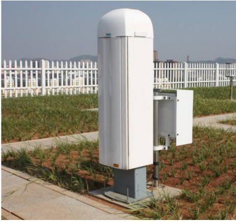
图2 芬兰维萨拉生产的CL31激光云高仪 Fig. 2 CL31 Laser Ceilometer made in Vaisala, Finland