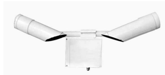
图6 前向散射能见度传感器 Fig. 6 forward scattering visibility sensor

传统的能见度观测依赖人工目测，其观测数值主观性强，无法做到量化、标准化。目前业务中已采用前向散射能见度传感器、透射式能见度传感器等测定一定基线范围内的气象光学视程，以此作为能见度的观测值。由于透射能见度传感器需要较长的基线，占地面积大 [22] ，目前我国地面观测业务中以使用前向散射能见度传感器（图6）为主。