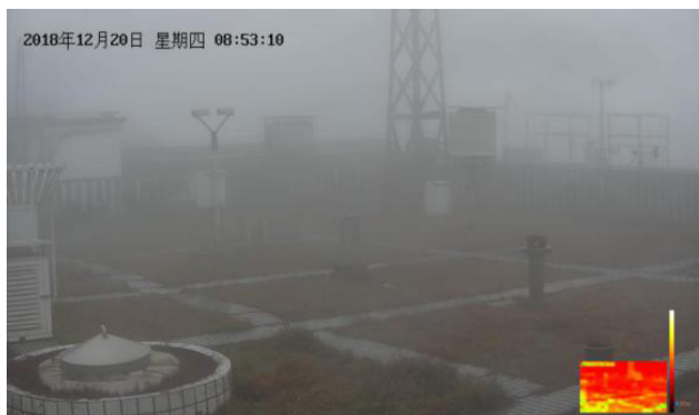
图10 雾的局部浓度视频观测示意图

湖南智能观测团队利用计算视觉技术，结合其他传感器资料，对雾的局部浓度进行视频观测，使在浓雾及重污染天气情况下的能见度观测值更接近人眼观测的目视能见度。该技术与现有能见度仪器结合，在团雾、碎雾、部分雾等情况下可测得更为精准的能见度值，并可将来能见度、视程障碍类天气现象的观测由点拓展到面，对各方向的目视能见度进行精准的观测(图10)。