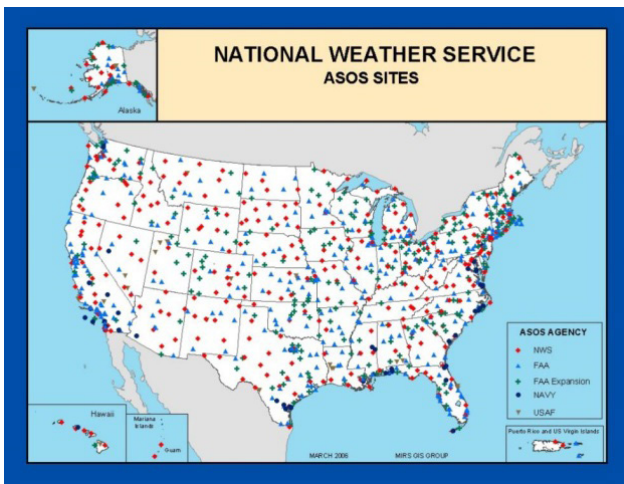
图1 ASOS站点分布图 Fig. 1 ASOS site distribution map

ASOS (Automated Surface Observing System) 是由美国国家海洋和大气管理局 (National Oceanic and Atmospheric Administration, NOAA)、民航局 (Federal Aviation Administration, FAA) 和国防部 (Department of Defense, DOD) 共建的一个地面自动观测系统。是美国目前地基气象观测的骨干和国家发报站网 (图1)。其观测和分析判识的基础是多种针对不同观测目标的传感器和设备，如：冰冻传感器、闪电定位仪、云高仪等，通过传感器和设备收集到高精度、高分辨率的数据，经过质量控制和智能算法，对特定观测任务完成具有较高精度的判识和数据采集。除了极少数几个重要城市、机场、港口外，均无人值守 [6] ，全部实现自动化。三个部门的需求有共同点，也有不同点，ASOS的设计较好地满足了三个部