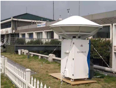
图3 观测场中的毫米波测云仪 Fig. 3 Millimeter wave cloud meter in meteorological observation field