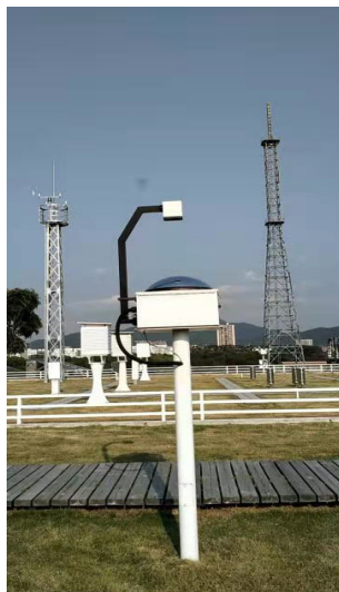
图4 TSI-800总天空成像仪 Fig. 4 TSI-800 Total Sky Imager

随着技术的发展，点阵式红外测云仪与面阵式红外测云仪能获取昼夜的全天空云底亮温，经过